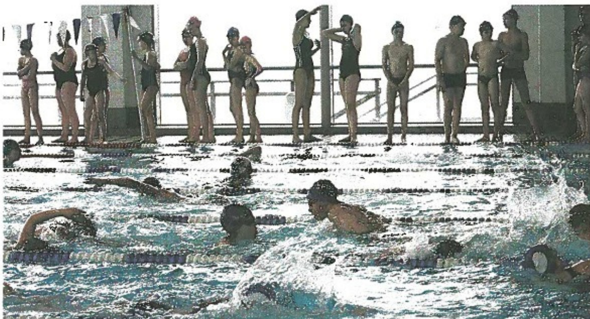
Det blev en lång kö till spurtträningsbanan under insimningen.

– Jag började att tävla i ryggsim först. Det är lättare för man startar nere och så är det mindre risk att man tappar glasögonen, sä-